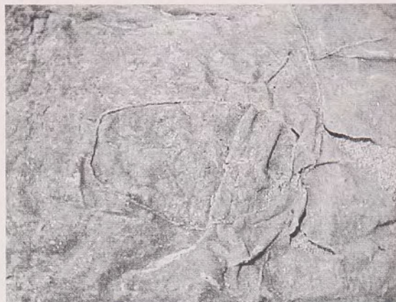
Fig. 2 a y b: Parches ovoides de dos capas.

cuidadosamente eliminadas al cortar las pieles en rectángulo. Las huellas de estacas corresponden a estacas más bien gruesas. Cada una de las pieles mide aproximadamente 35 x 60 cm siendo la medida total de la capa de 95 x 105 cm. La capa presenta una seguidilla de pequeños ojales separados cada 18 mm en uno de los cueros, un remiendo y un ojal que lleva una tira de nervio trenzada que pudo conectarse de algún modo con los ojales.