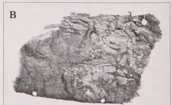
Fig.5 a y b: Capa con huellas de estaqueado.