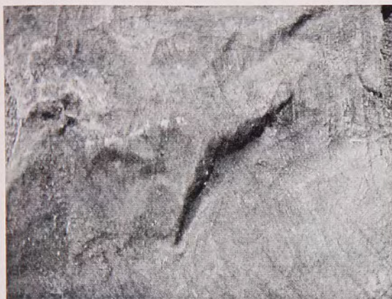
Fig.6: Huellas de raspado.

Cuero No 3: Fragmento. Este cuero presenta orificios en un borde formatizado, separados cada 3 y 4.5 cm. También tiene una huella de estaqueado circular, gruesa. Además presenta una especie de tetilla muy pequeña. Mide 48 x 28 cm.