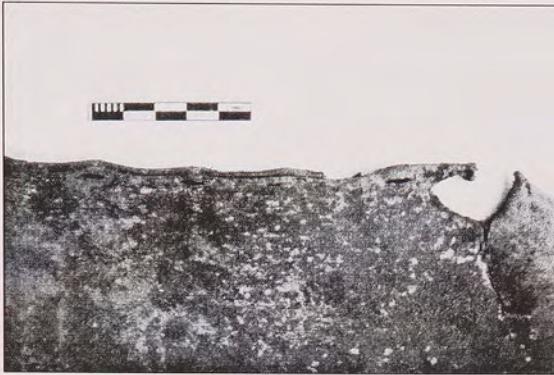
Fig.4: Reborde cortado.