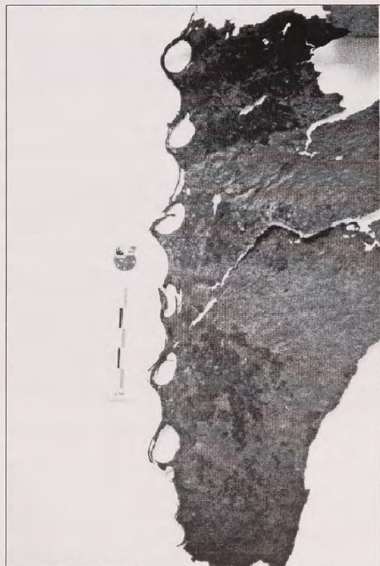
Fig.7: Estaqueado grueso en el caso del canal Abra.