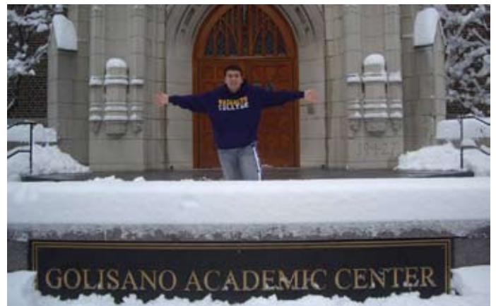
En el Nazareth College, en Rochester.

“Ahora han surgido muchos proyectos personales, como el querer viajar por el mundo, ya que me di cuenta que viajar es la mejor manera de aprender de otras culturas”, recalcó el estudiante.