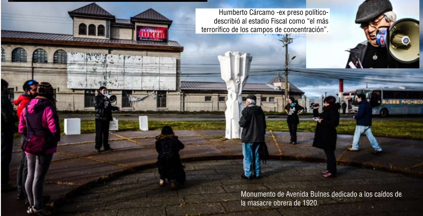
Monumento de Avenida Bulnes dedicado a los caídos de la masacre obrera de 1920.