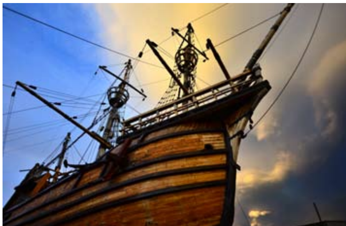
La Victoria, una de las cinco naves de la expedición del navegante portugués, replicada en el Museo Nao Victoria en Punta Arenas.

“La llegada de Magallanes marcó la incorporación de los confines australes americanos a la historia de Europa, junto con el inicio de la participación de estos confines y su gente en los avances, beneficios y turbulencias de la historia universal”, añadió.