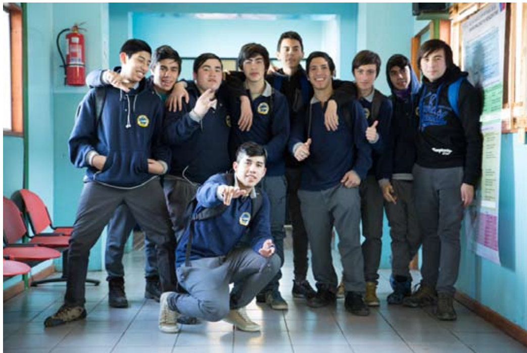
Alumnos del Liceo Luis Cruz Martínez de Puerto Natales que asistieron a la función.

el verano de 1936 pretendía llevar a los niños a conocer el mar por primera vez, sin embargo en julio de aquel año sería fusilado, pero nunca olvidado ni en Burgos ni en los países que conocieron sus cuadernillos.