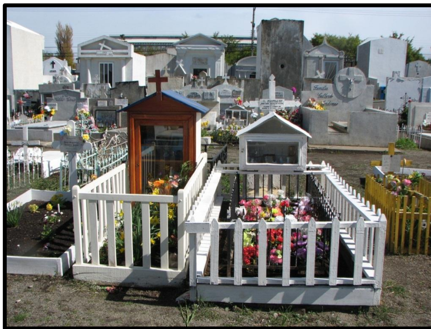
Imagen 4. Sepulturas del Cementerio Municipal de Punta Arenas.