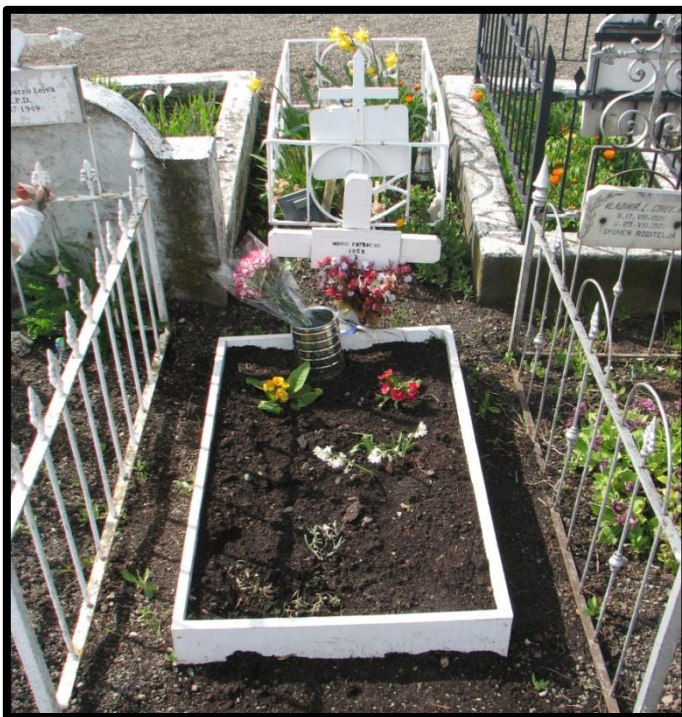
Imagen 3. Sepultura del Cementerio Municipal de Punta Arenas.