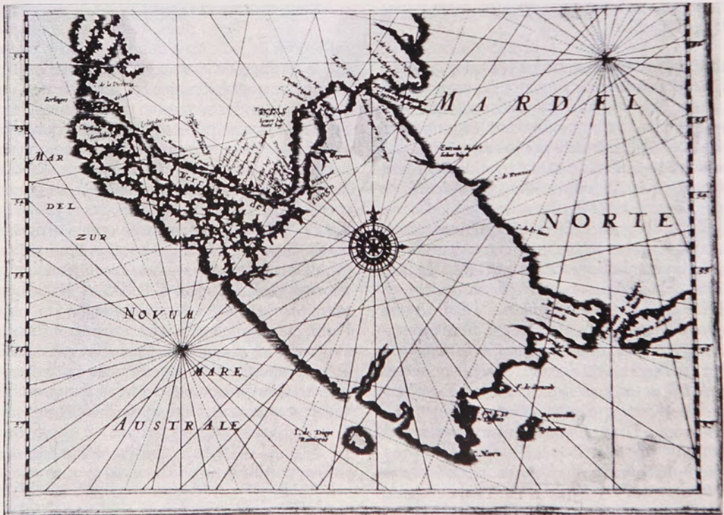
Fig. 3 Carta del Estrecho de Magallanes y Tierra del Fuego. Autor holandés desconocido (ca.1620)