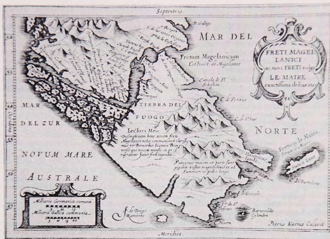
Fig. 4 Freti Magellanici ac novi freti vulgo Le Maire exactissima delineatio de Pieter Keer, Map Room, British Library.

la tercera expedición de que se trata, limitándose a exponer los argumentos en favor y en contra de su realización. También se ocupó del asunto el historiador argentino Enrique Ruiz Guiñazú (1945), quien trata de manera confusa la materia, pues tanto afirma que el rey de España encomendó a Juan de Morel la expedición de verificación del hallazgo holandés (1945:135), como reconoce más adelante la realización de la expedición de los hermanos Nodal (1945:137).