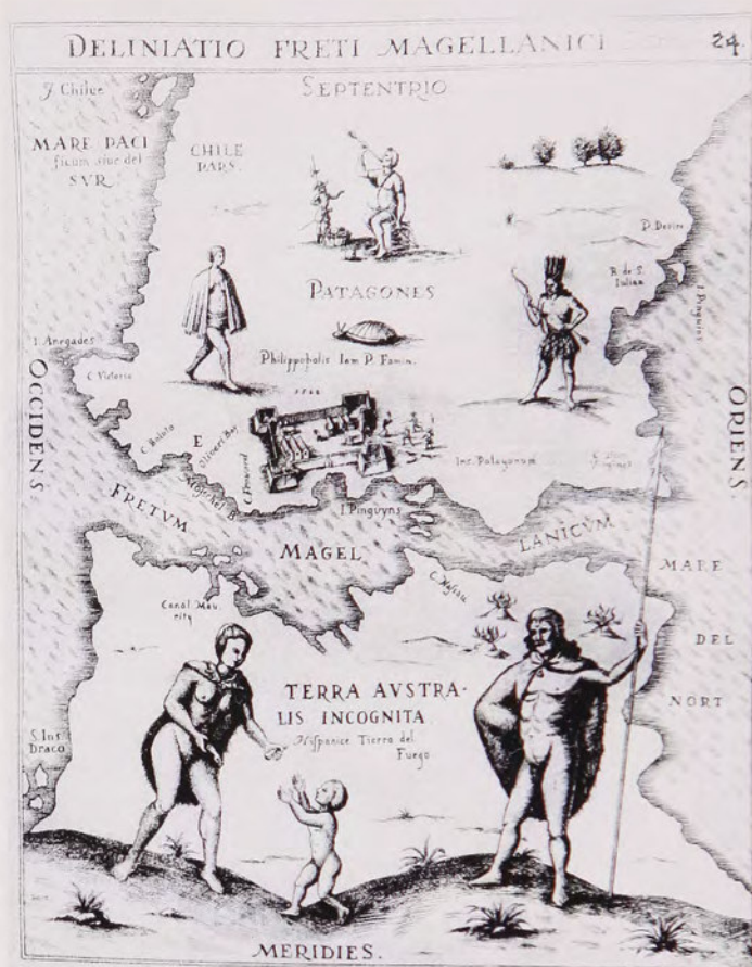
Fig. 2 Mapa del Estrecho de Magallanes, mostrando la fortaleza española establecida por Sarmiento en 1584; de la Colección de Viajes de Levinus Hulsius, Theil VI (1603)

Para la década de 1570, la atención inglesa se había concentrado aún más en el cono sur. El 19 de abril de 1570, el embajador español en Londres informó que un marinero portugués, Bartolomeu Bayão, estaba discutiendo con grupos interesados un proyecto para ocupar y colonizar uno o dos puertos en el reino de Magallanes, para así tener en sus manos el comercio del Mar del Sur... además de poder acercarse tanto como lo deseaban al Perú 7 . Cuatro años más tarde, Richard Grenville presentó a la Reina Isabel un proyecto para establecer asentamientos ingleses en toda el área entre el Río de la Plata y Chile, que daba seguridades: de la probabilidad de traer grandes tesoros de oro, plata y perlas a este reino de aquellos países, como otros príncipes tienen de regiones similares 8 . Que Grenville tenía en