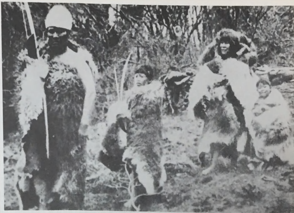
Onas, cazadores de tierra firme

La sociedad de estos aborígenes era de carácter igualitario. No había jefaturas permanentes. Para cada acción se escogía normalmente como dirigente al más capacitado, al que más vehementemente proponía la tarea,