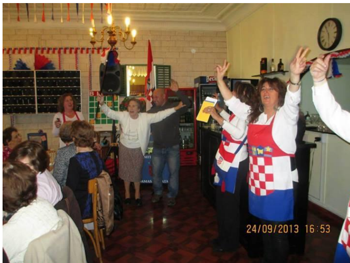
Bingo organizado por las Damas Croatas, en septiembre del 2013.