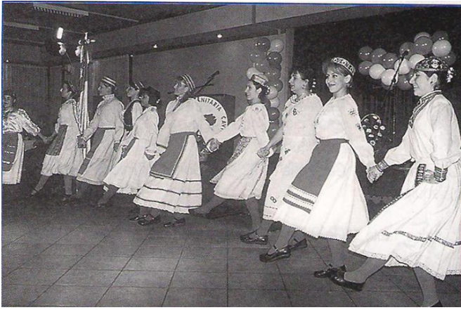
Conjunto Folclorico Dalmacia, en 1920

Diario Male Novine, se observan distintas ediciones, en el club croata.