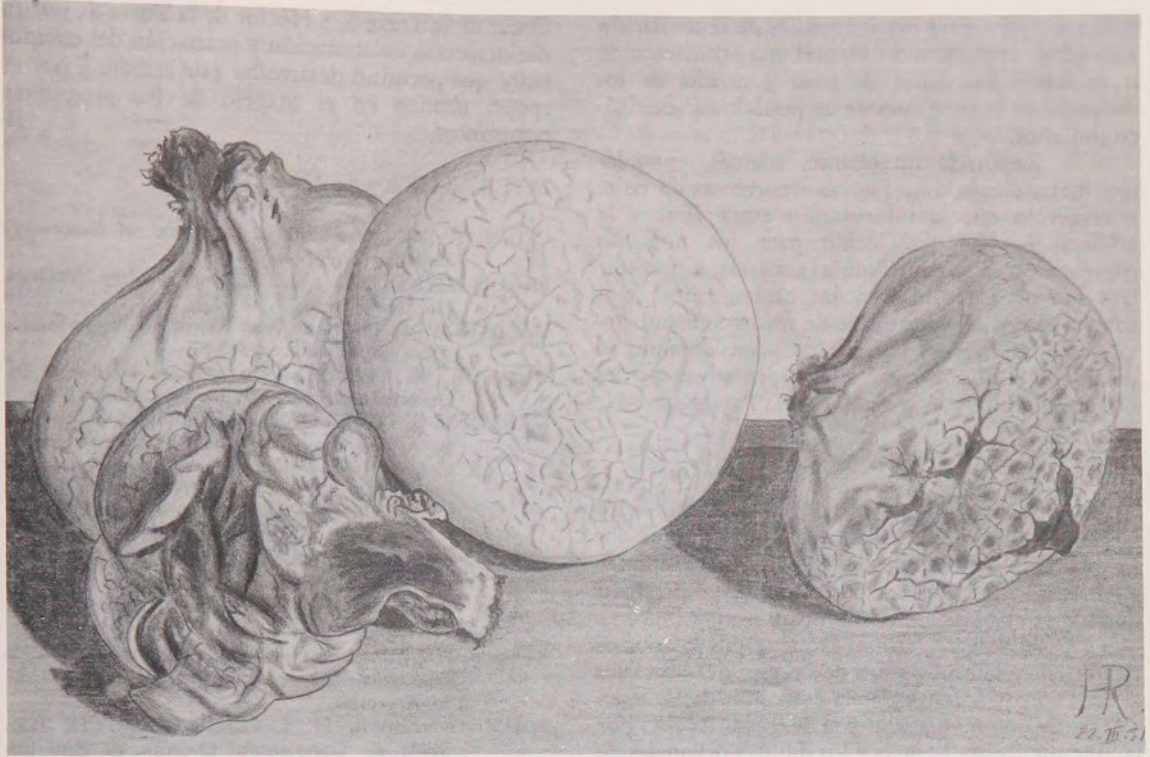
Fig. 5. Calvatia utriformis , sinónimo de Calvatia caelata . Especie comestible en estado inmaduro, cuando se encuentra completamente blanco. Dibujo de Juana Roehrs.