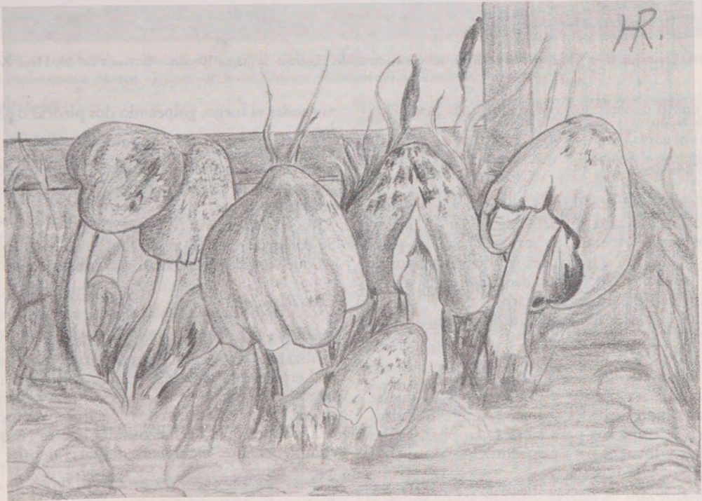
Fig. 3a. y 3b. Variedades de especies de Coprinus comatus , hongo comestible cuando se encuentra completamente blanco (sin mezclar con bebidas alcohólicas). Dibujo de Juana Roehrs.