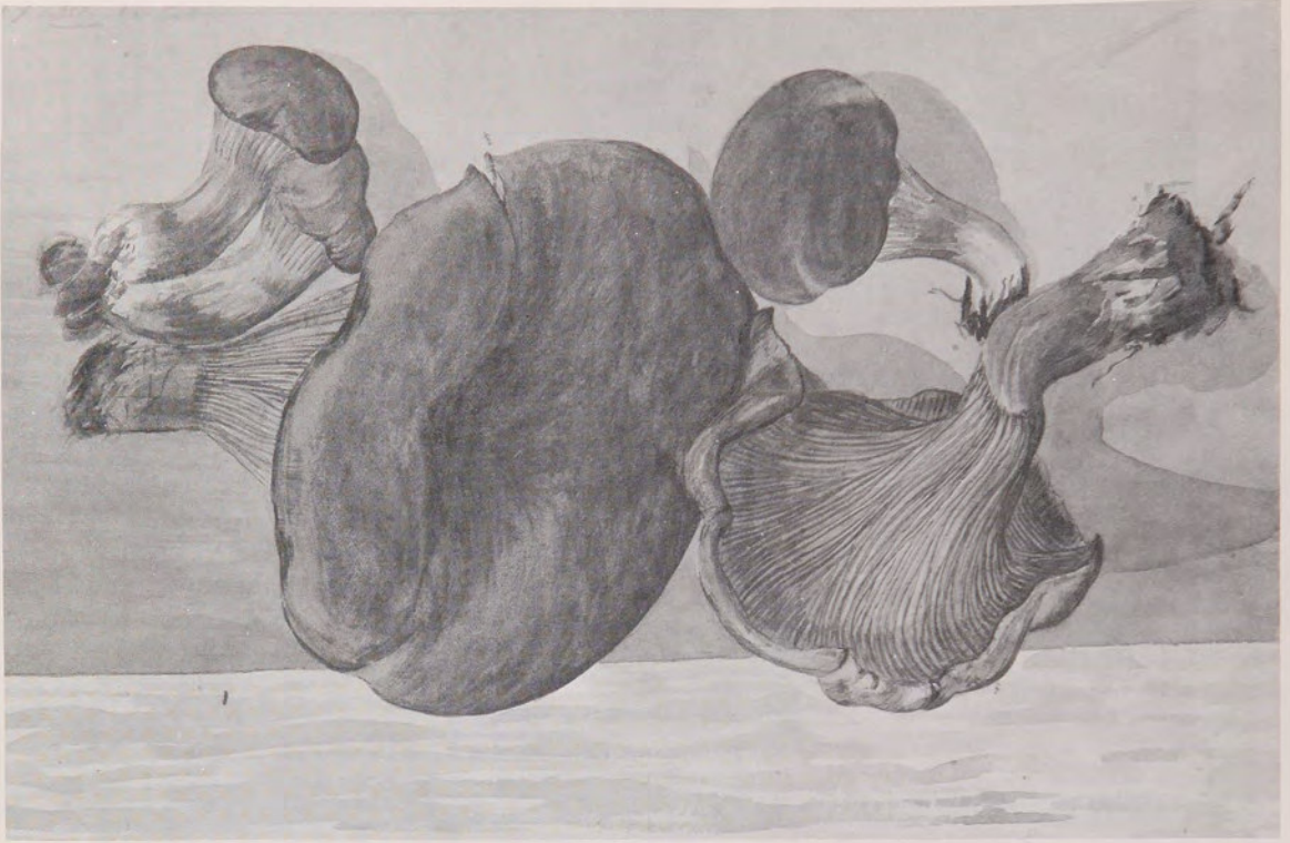
Fig. 4. Especimens de Cantharellus cibarius , hongo comestible. Dibujo de Juana Roehrs. Cortesía del Sr. Hans Roehrs.

kenk, como ocurría con otros indígenas magallánicos.