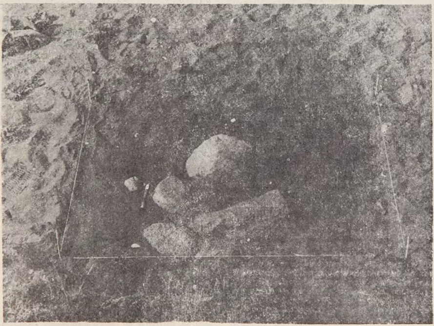
Fig. 2: Bloques pétreos dispuestos sobre el esqueleto humano.