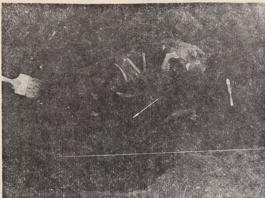
Fig. 3: Esqueleto flectado cubierto con colorante rojo, exhumado en San Gregorio 11.

latinamente en forma natural, conservándose al cabo de un tiempo tan sólo el esqueleto. En ambos casos, San Gregorio 11 correspondería a una morada secundaria de carácter definitivo para dichos restos.