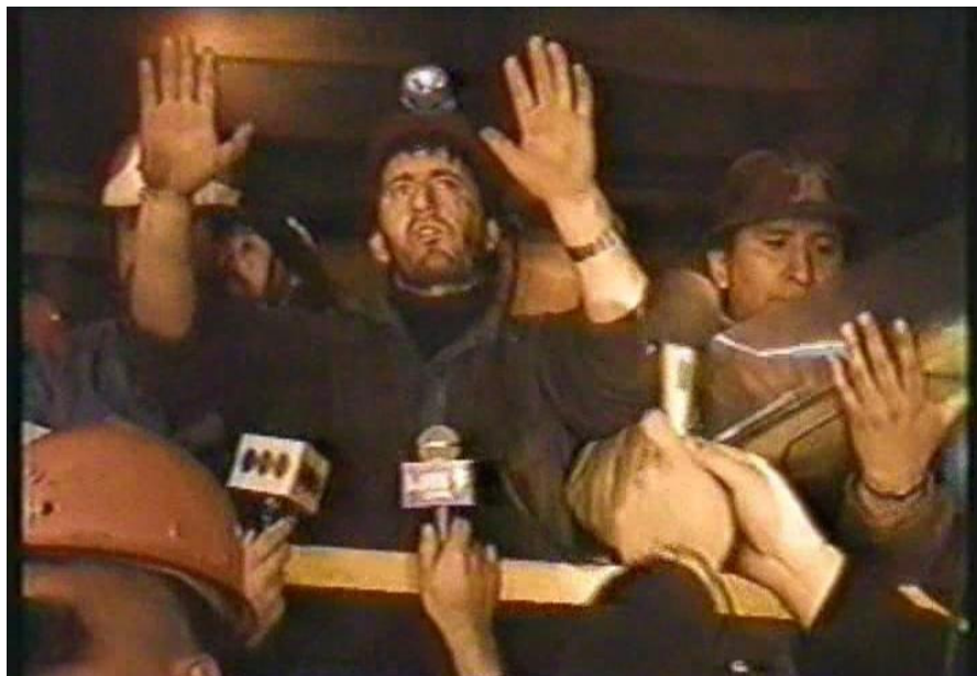
6.- Reuniones de información al interior de la mina