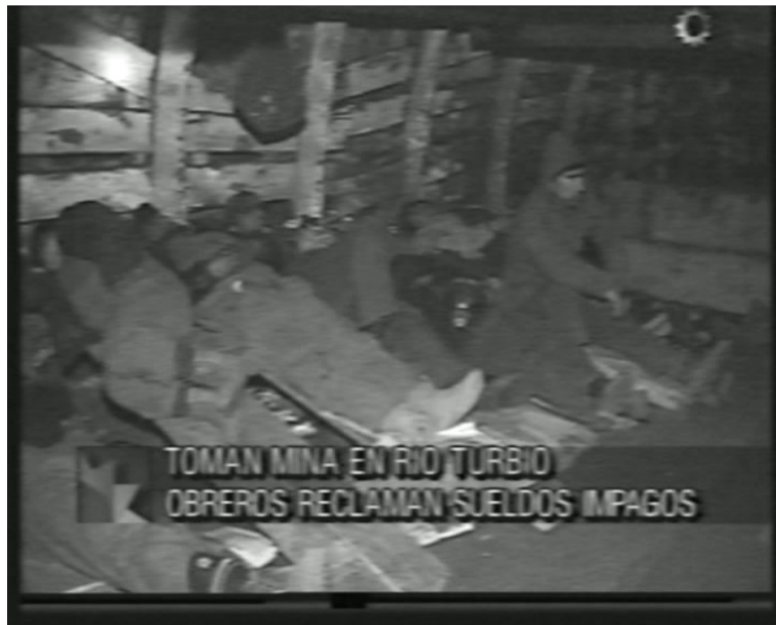
5.- Mineros en el sector "Unión 24"