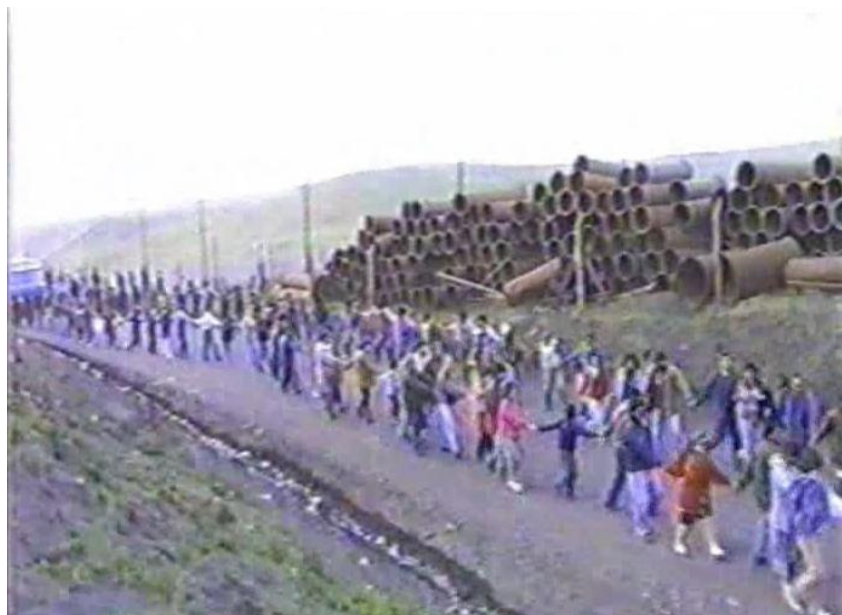
12.- Comunidad acompañando a los mineros en su salida de la mina finalizada la toma.