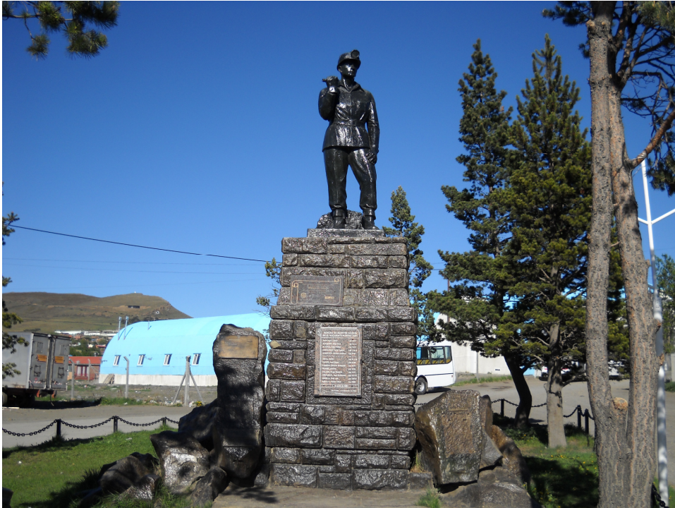
1.- Monumento al trabajador minero ubicado en Río Turbio, Argentina.