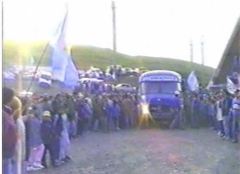
11.- Salida de los mineros una vez finalizada la toma