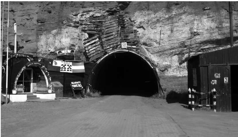
2.- Entrada a la mina n° 5. Lugar donde se desarrollo la toma (1994)