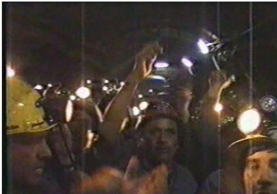
8.- Mineros al interior de “Unión 24”