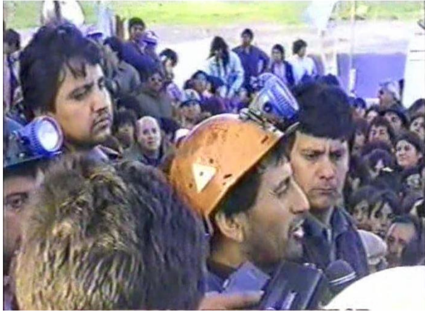
9.- Reunión informativa entre el vocero de la toma y los familiares al exterior de la mina.