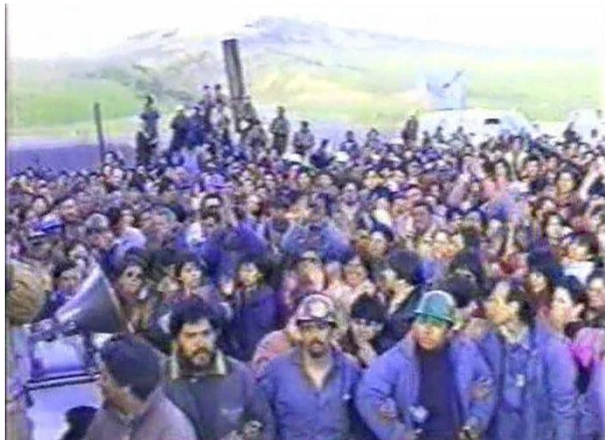
10.- Apoyo de la población en el exterior de la mina.