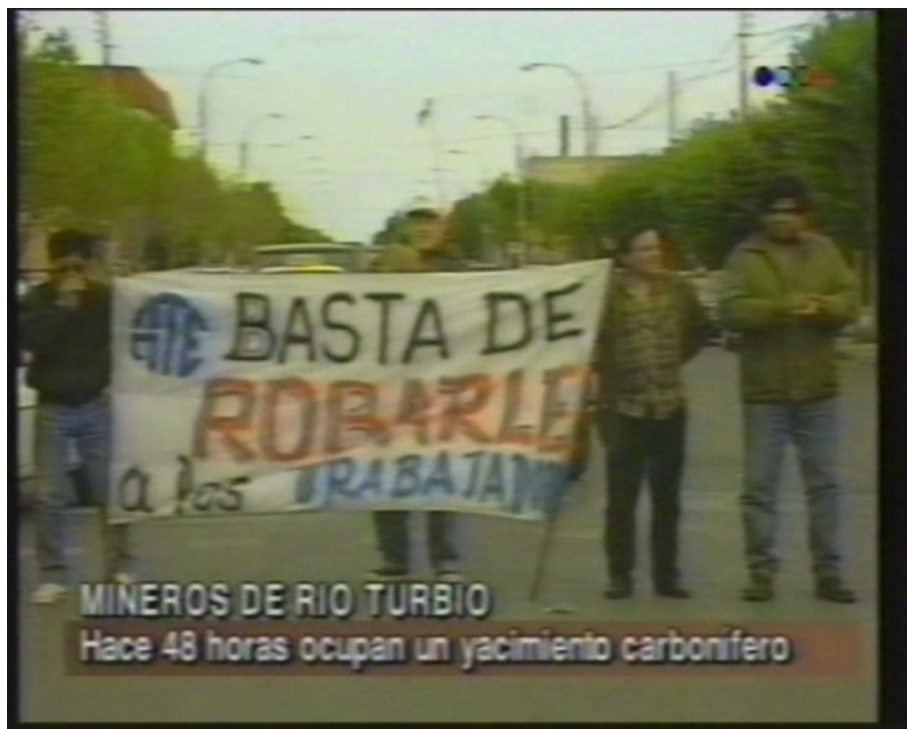
4.- Manifestaciones en Río Gallegos en apoyo a la toma de la mina en Río Turbio.