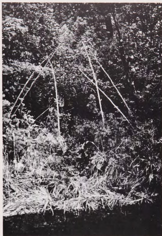
Fig. 1 Restos de estructura de una choza kawéskar en isla Latorre

Paralelamente, secciones de Nothofagus betuloides , fueron estimadas en diferentes lugares de la costa norte de la isla Riesco (Rocallosa, Punta Adelaida, Punta Garay) para completar la operación de determinación de una secuencia dendrocronológica de referencia. Un árbol viejo pudo permitir también cubrir casi los cuatro últimos siglos remontando hasta 1660. Concluida esta primera etapa de calibración, estuvimos en condición de seguir año tras año el crecimiento medio común de los Nothofagus de este sector del mar de Skyring.