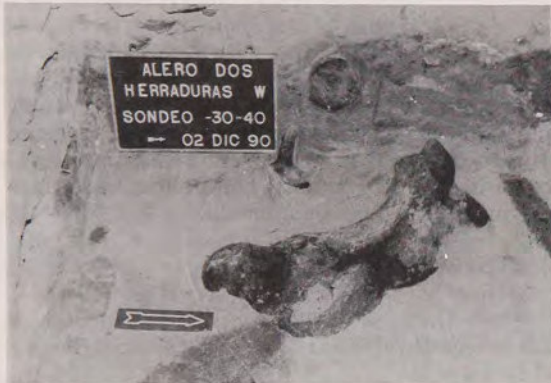
Fig. 3. Alero Dos Herraduras Oeste, Sondeo. Fémur de Mylodon darwini incluido en la capa de cenizas volcánicas.

riales recién mencionados, se ubicaron restos de Mylodon darwini , incluyendo un fémur, una costilla, fragmentos de otra costilla y numerosos huesecillos dérmicos (Fig. 3). Hay algunas lascas, una de ellas directamente en contacto con el fémur. Ni en este ni en ninguno de los demás huesos atribuibles a Mylodon se observaron huellas que se puedan interpretar como de trozamiento o de corte. También hay que decir que se identificaron túneles, y que algunos de los huesos de roedor estaban dentro de los mismos. En uno de dichos túneles se encontró una lasca. Recientes trabajos experimentales han mostrado que la acción de roedores puede producir numerosos túneles no detectables, y por ende mucha perturbación (Durán MS). Todo esto implica que en este momento no se puede hablar de asociación entre megafauna y restos culturales. Se deberá esperar la ampliación de los trabajos.