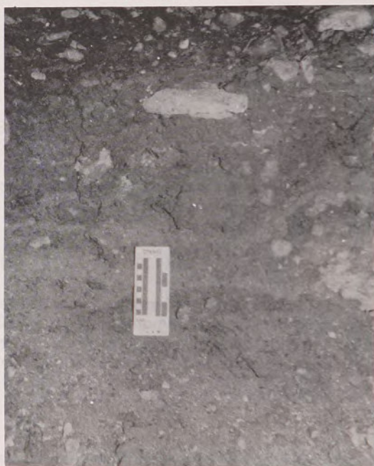
Fig. 2. Cueva del Milodón, Perfil 2. Excrementos de Mylodon darwini y fragmentos de roca caídos del techo.

Perfil 3: Localizado en el sector de la Trinchera 2 de Saxon (1979: 332). Se excavó hasta una profundidad de 2.5 m, sin llegar a roca de base. Se recogieron muestras de sedimentos y de huesos. Hugo G.