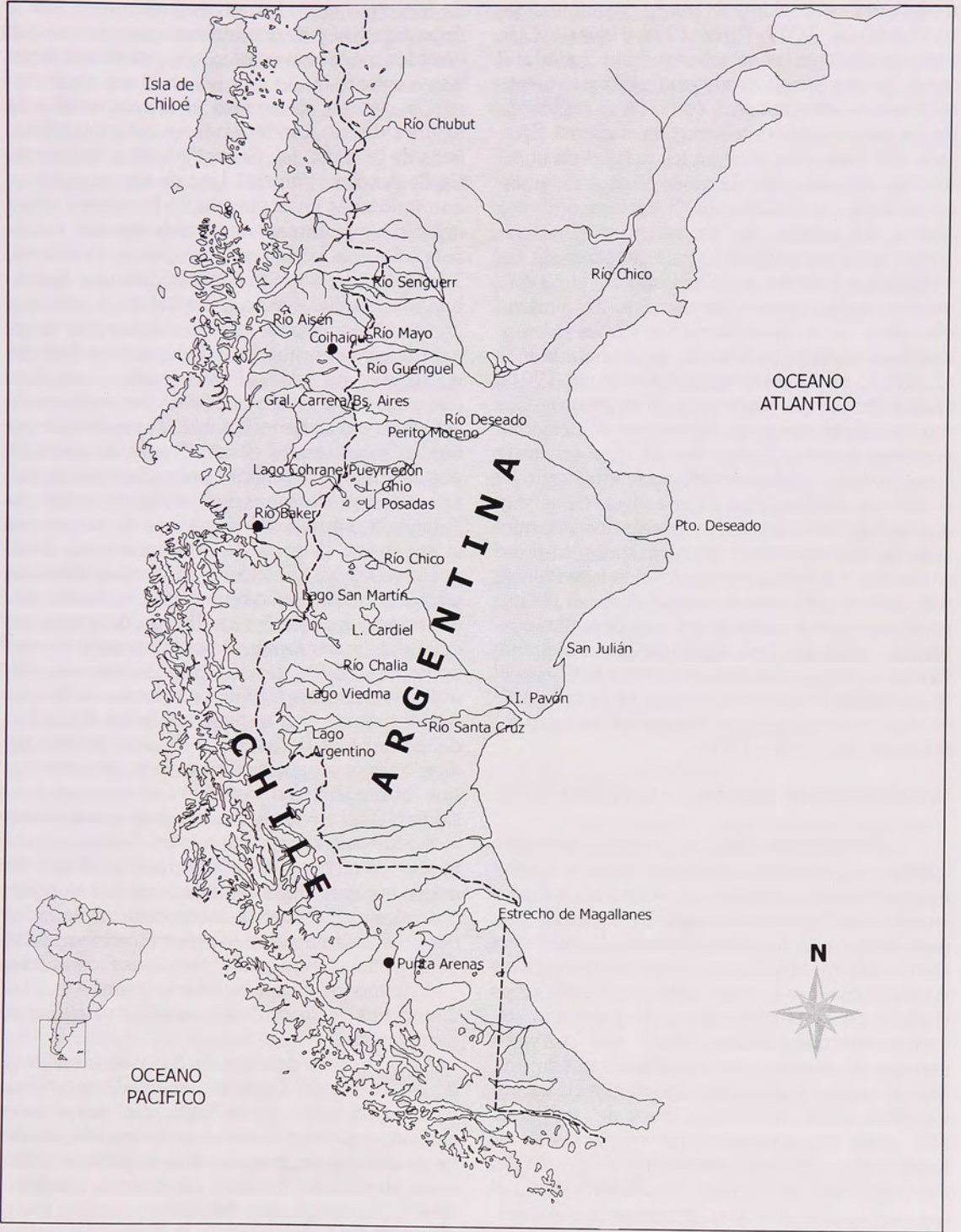
Fig. 1 Patagonia general.