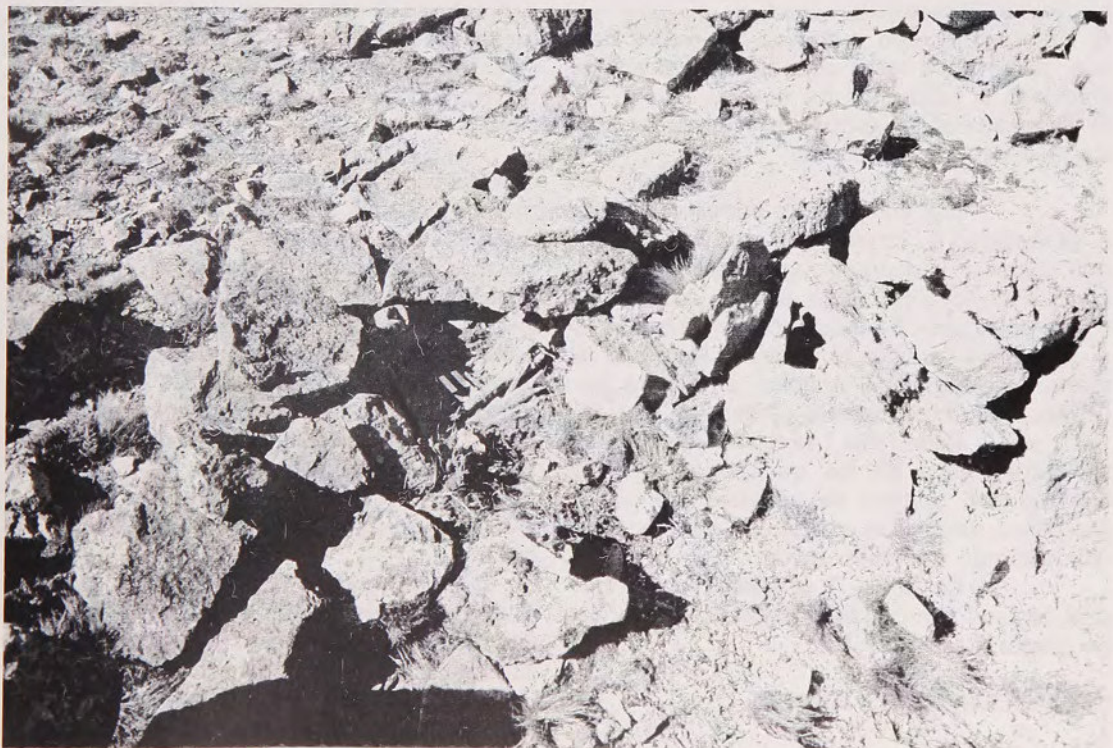
Fig. 5 Campo de chenques detalle de chenque con restos óseos expuestos.