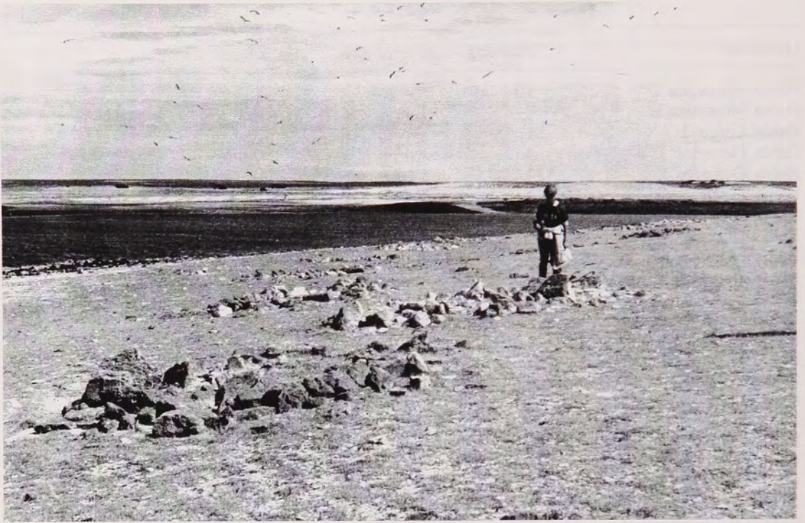
Fig. 2 Chenques en Isla Liebres