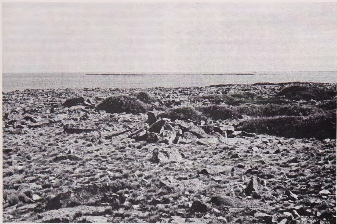
Fig. 4 Campo de chenques vista de estructura mortuoria «chenque».