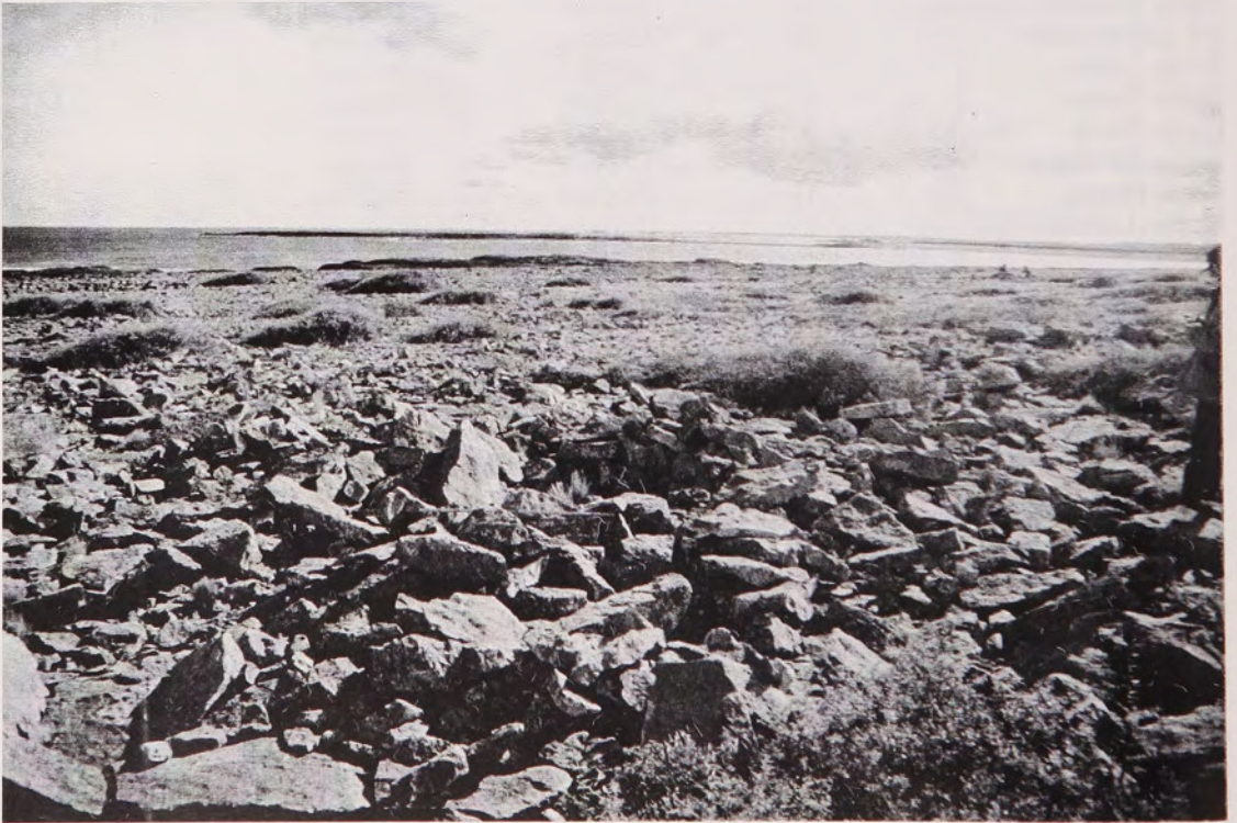
Fig. 3 Campo de Chenques y vista parcial de asociación de tres chenques