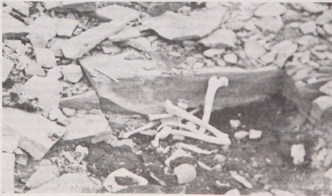
Fig.1 Tumba indígena en la Sierra Contreras (Fotografía 29-1-1941).

En la ladera de una duna cercana a la costa se halló un enterratorio conteniendo los restos de 3 individuos, contenía cuentas de collar vítreas y ador-