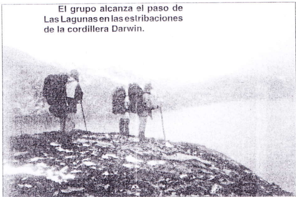
El grupo alcanza el paso de Las Lagunas en las estribaciones de la cordillera Darwin.