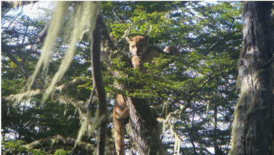
Puma en estado salvaje. Foto captada en el sector de Morro Chico. 2009