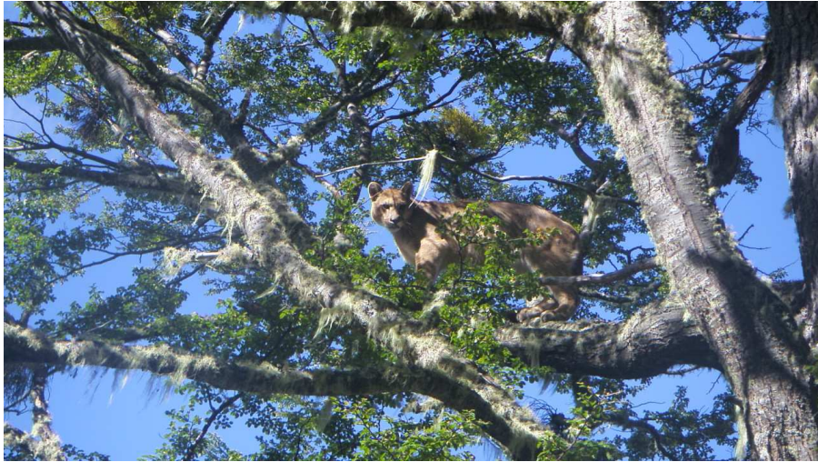
Puma en estado salvaje. Foto captada en el sector de Morro Chico. 2009