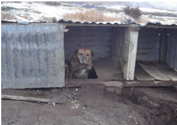
Perro galgo utilizado para caza de Pumas. Sector Cerro Castillo. 2009