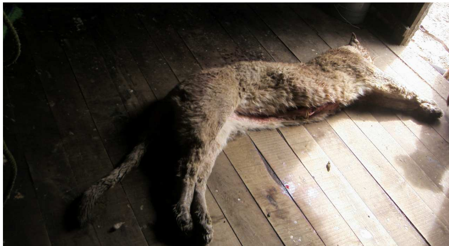
Cadáver de Puma. Fotografía captada el 2009.