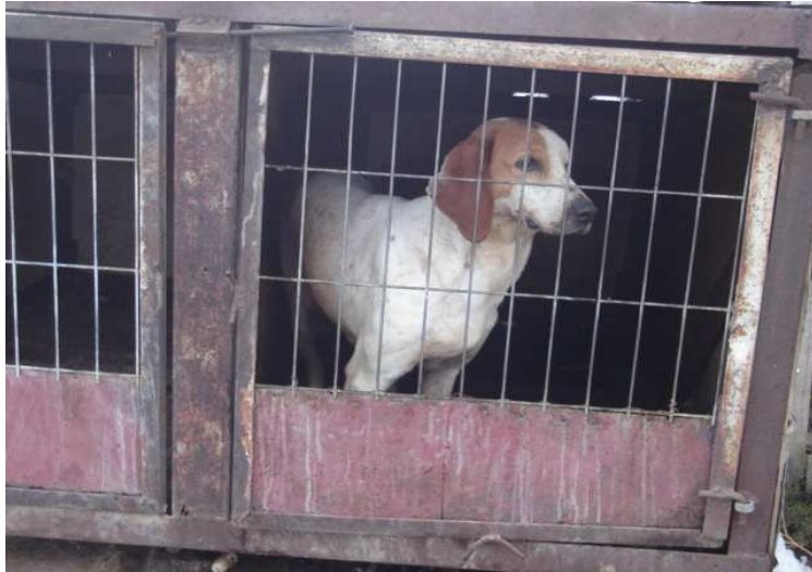
Perro Fox Hunter utilizado para caza de Pumas. Sector Cerro Castillo. 2009