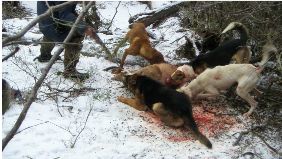
Caza de Puma en la Región de Magallanes y Antártica Chilena. Fotografía captada el 2009.