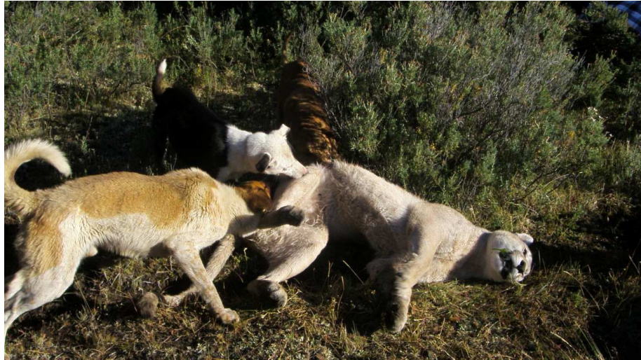
Caza de Puma en la Región de Magallanes y Antártica Chilena. Fotografía captada el 2009.