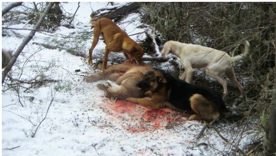
Caza de Puma en la Región de Magallanes y Antártica Chilena. Fotografía captada el 2009.