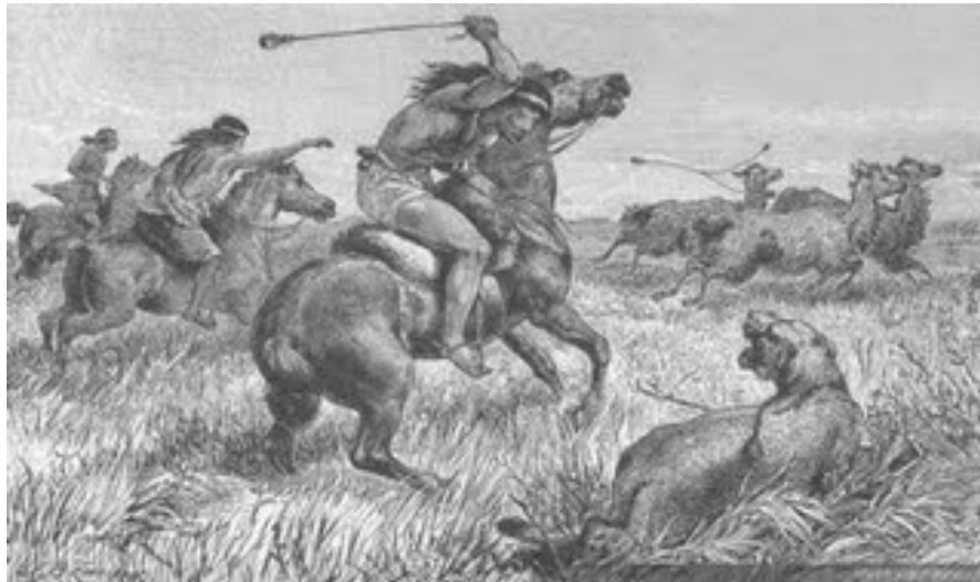
Aónikenk cazando Puma. Siglo XIX.