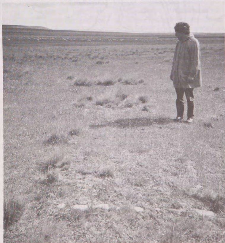
Fig. 2.- Restos de un pasillo empedrado en el acceso a la vivienda.