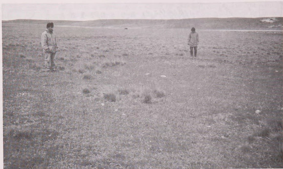
Fig. 1.- Sector del valle del río Zurdo donde se encontraron restos de una habitación (centro-derecha).