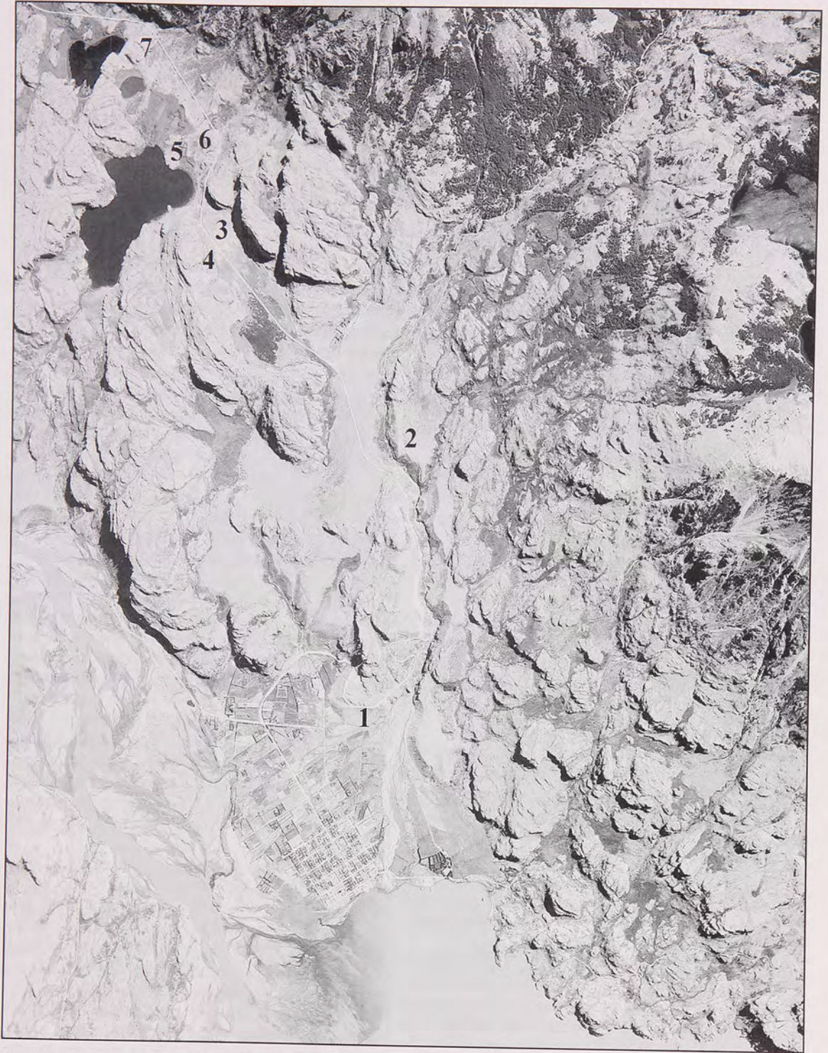
Fig. 2 Vista aérea de la desembocadura del río Ibáñez en la costa norte del lago General Carrera. N° 1: cementerio de chenques de Pto. Ing. Ibáñez. N° 2: Chenque Kunick. N° 3: Chenques en cerros islas en El Juncal. N° 4: Sitio RI-18; inhumación en alero con arte rupestre. N° 5: Posible entierro múltiple en un promontorio de laguna Sepúlveda. N° 6: Posible chenque cercano al camino. N° 7: Posible chenque en un promontorio.