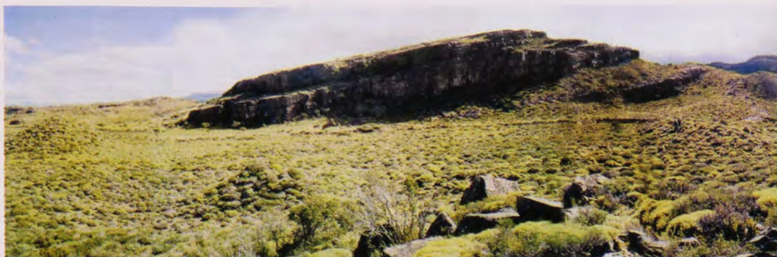
Fig. 3 Sector El Juncal. La foto está tomada desde uno de los tres chenques saqueados, los cuales están ubicados sobre los cerros islas del plano. Al fondo, a unos 300 m, se observa el sitio RI-18, un alero con pinturas rupestres y un inhumación fechada en 410 \pm 40 años AP.

De las veintitrés inhumaciones detectadas, sólo seis se encuentran dentro de los sectores de prospección: tres de ellas en el sector El Juncal y otras tres en el sector laguna Sepúlveda. El resto, se registró por su relevancia y cercanía a los sectores considerados formalmente por la prospección: Cementerio de chenques de Puerto Ibáñez ( n=14 ), chenque Kunick ( n=1 ). Agregamos a este estudio, un entierro excavado el año 1983 por investigadores de la Universidad de Concepción (Berquist et al. 1983) en el sector de prospección El Juncal, muy cercano a los otros chenques descubiertos (ver Figs. 2 y 3).