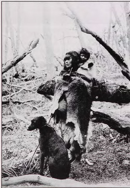
Fig. 4. Mujer y niño Selknam con sus atavíos y perro. Esta es una de las pocas fotografías en que aparece retratado con tanta claridad el llamado perro fueguino.

Como mencionamos anteriormente, la recolección de objetos estaba guiada por los particulares criterios que definían qué artículos indígenas son de "real interés". Por ejemplo, volviendo