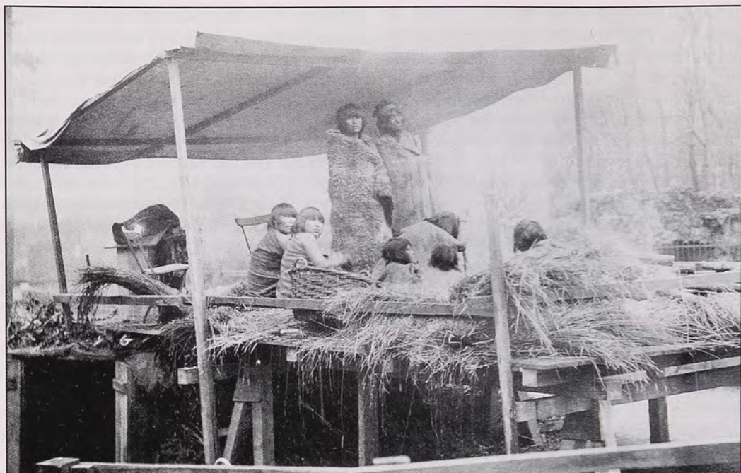
Fig. 1. Exhibición de fueguinos en Europa. Reproducida con el permiso del Museo Nacional de Etnografía, Estocolmo, Suecia.