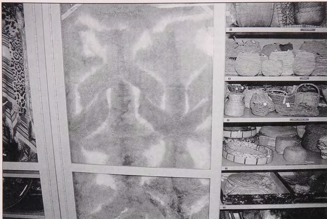
Fig. 2 Una vista de objetos fueguinos (quillango y cestos de juncos) en el deposito de colecciones del Museo Etnográfico de Berlin.

indígenas eran exhibidos publicamente en las grandes urbes europeas (Fig. 1). Esto queda de manifiesto en el caso de un grupo de kawéshkar que fue llevado a Europa en 1881: Los casos de muerte de algunos miembros del grupo en Zürich desató una verdadera carrera entre los científicos, pero no para dispensar a los aún vivientes de la mejor atención médica, sino para llegar a poseer alguna de las partes del cuerpo del muerto conservadas en alcohol (Eissenberger, 1993:87).