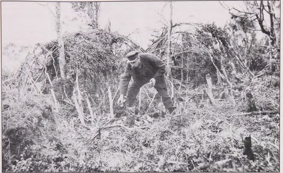
Fig. 5 Miembro de la Expedición Vanadis colectando objetos junto a una choza indígena abandonada.

hecho que los objetos etnográficos se transforman en mercancías.