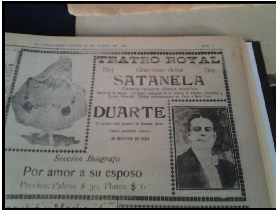
Obra de Teatro Satanela, Teatro Royal 1920