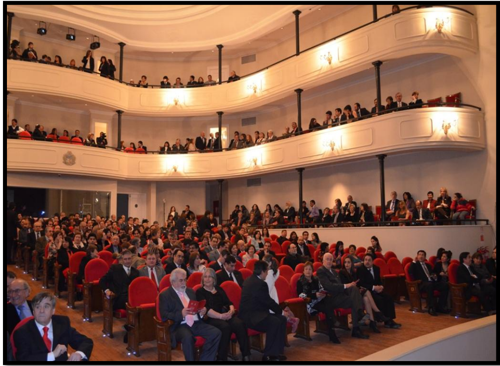
Actual Teatro Municipal de Punta Arenas José Bohr