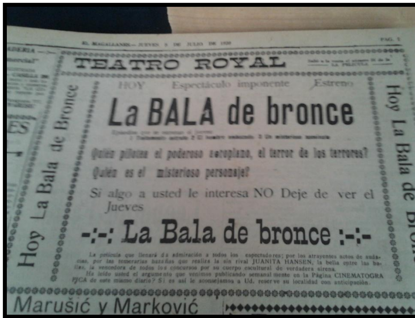
Obra La Bala de Bronce, Teatro Royal