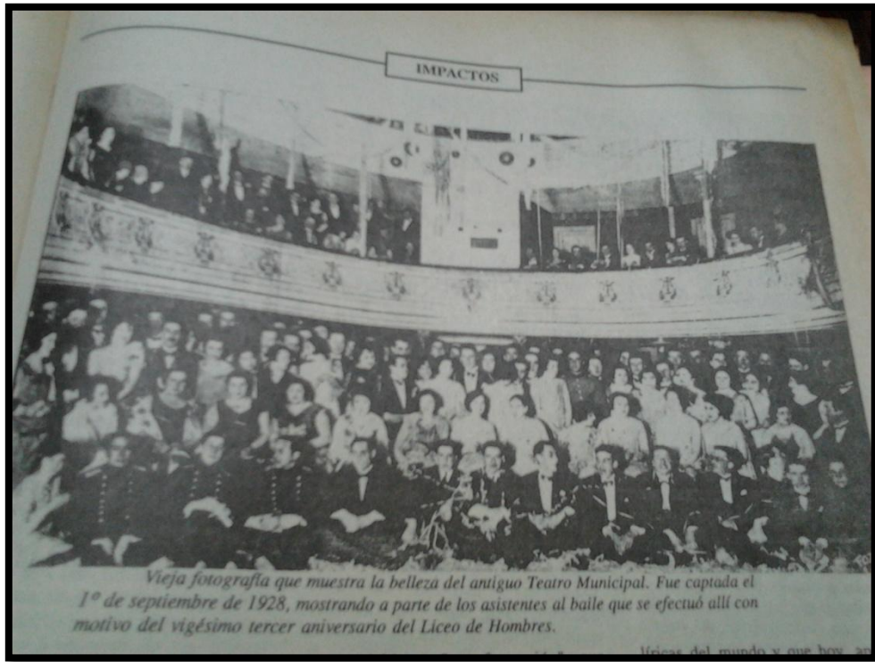
Fotografía que plasma el Teatro Municipal, 1 de Septiembre de 1928