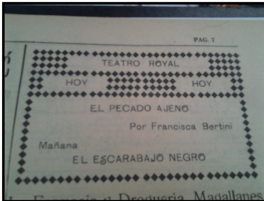
Obra El Pecado Ajeno , Teatro Royal