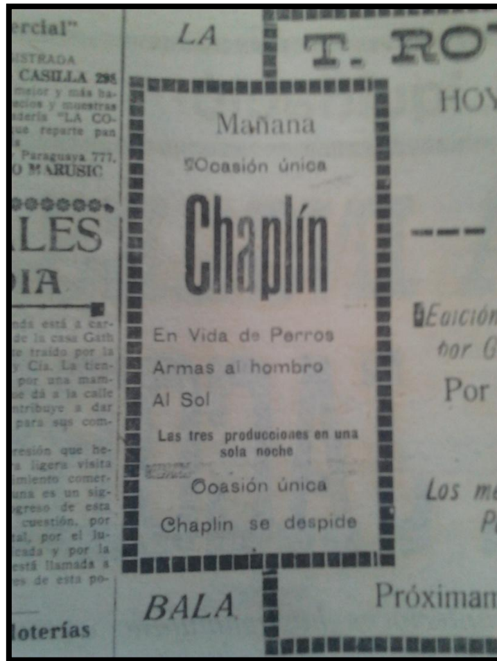
Obra de Charles Chaplin

Obras que se presentaban en los Teatros del Periodo de Oro en Punta Arenas