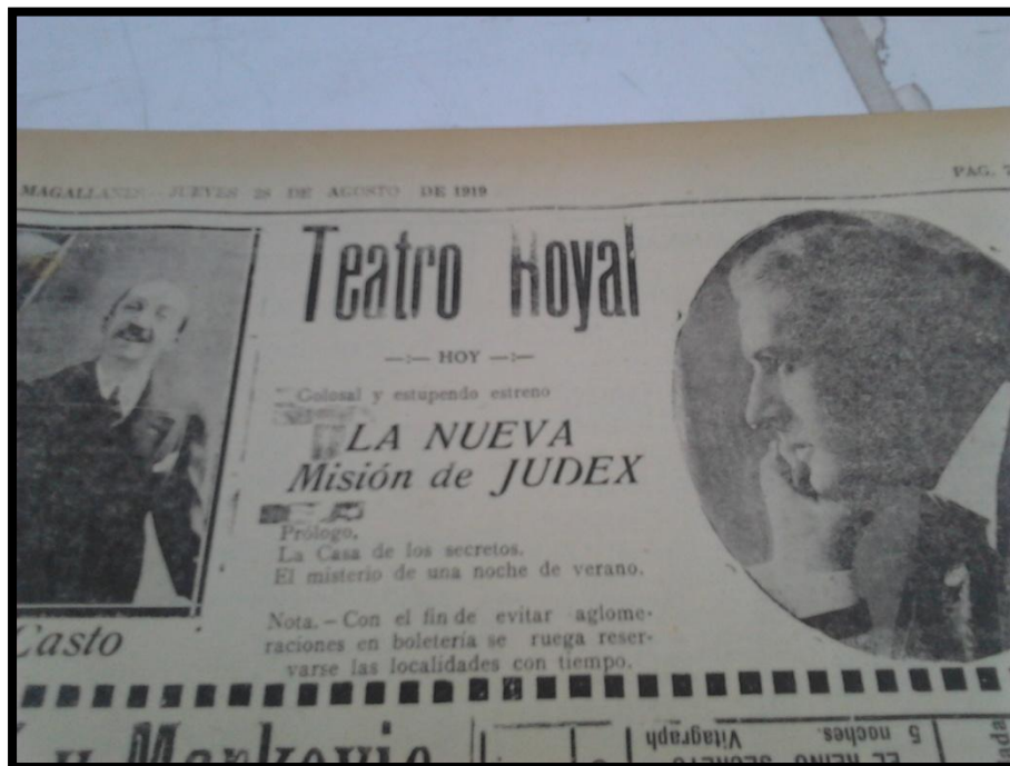
Obra de Teatro La Nueva Misión de Judex, Teatro Royal 1919